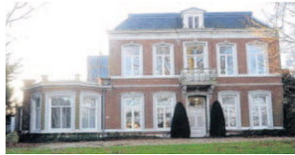
De villa aan de Goesestraatweg in Kapelle is een van de drie beoogde locaties voor de Academie.