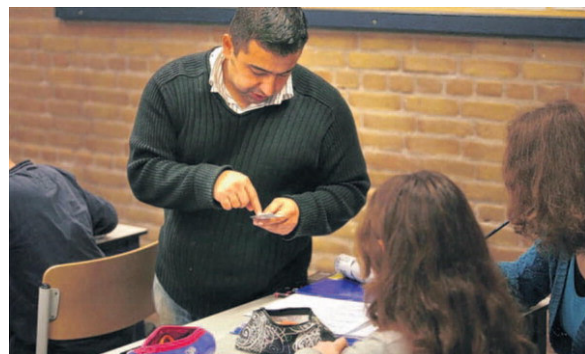
Maar 11 procent van de leerlingen uit het klassikale onderwijs vindt dat het tempo van de lessen aansluit op zijn niveau, blijkt uit onderzoek.